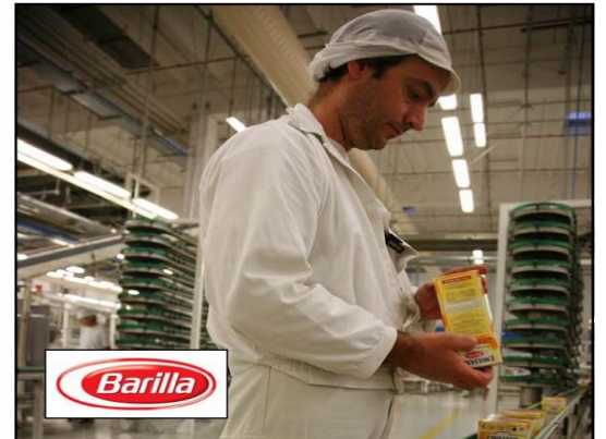
Regolatori di potenza 20KVA 20KVA Power regulators