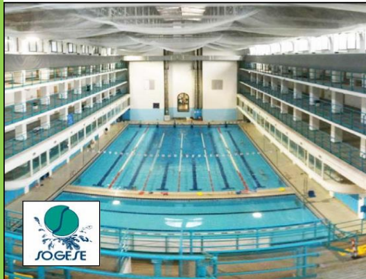
Regolatori di potenza 144KVA 144KVA Power regulators

Regolatore di potenza 8KVA 8KVA Power regulators