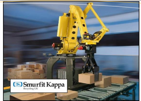
Regolatore di potenza 24KVA 24KVA Power regulator