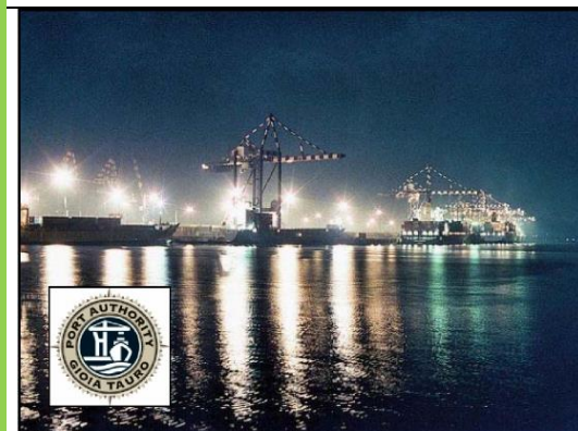
Port of Gioia Tauro - Italy