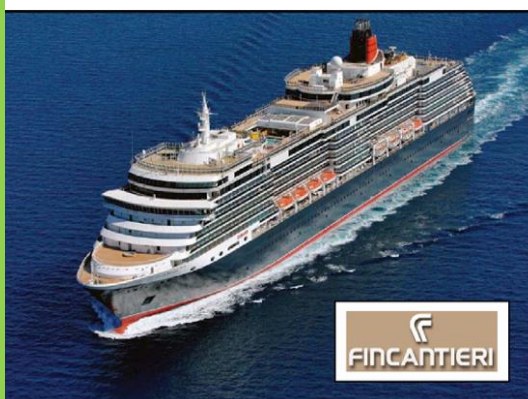
Regolatori di potenza 1500KVA 1500KVA Power regulators