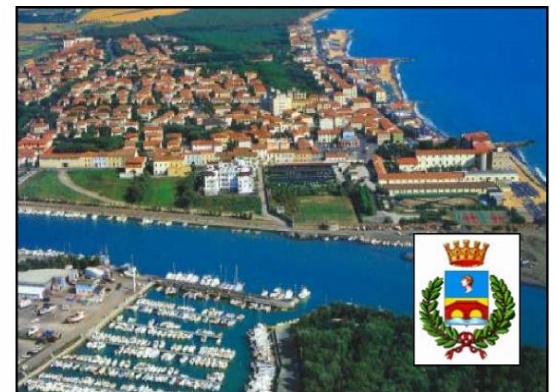
Comune di Cecina (LI) Regolatori di potenza 80KVA 80KVA Power regulators