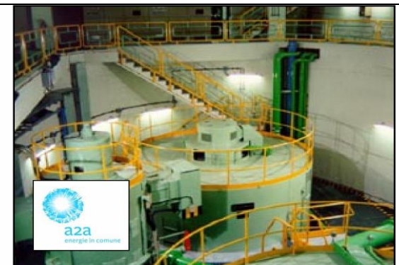
Regolatori di potenza 300KVA 300KVA Power regulators