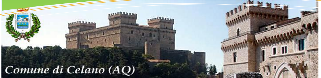
Comune di Celano (AQ)

Regolatore di potenza 8KVA 8KVA Power regulators