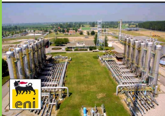
Regolatore di potenza 80KVA 80KVA Power regulator