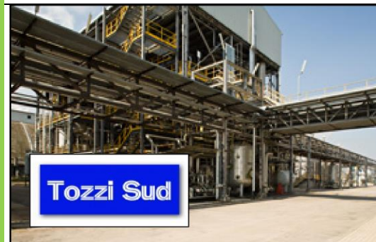
Regolatori di potenza 140KVA 140KVA Power regulators