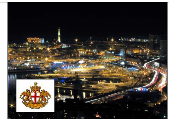
Port of Genoa - Italy