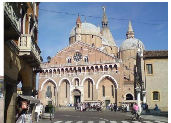
Regolatore di potenza 96KVA 96KVA Power regulator