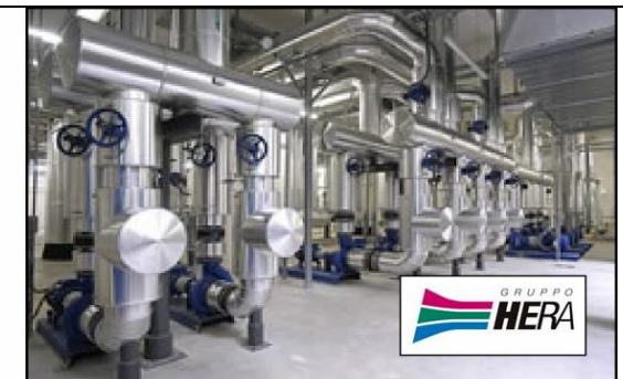
Regolatori di potenza 54KVA 54KVA Power regulators