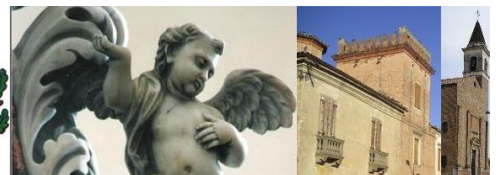
Regolatore di potenza 35KVA 35KVA Power regulator