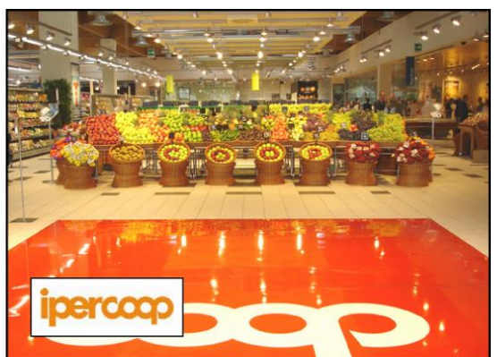
Regolatori di potenza 200KVA 200KVA Power regulators