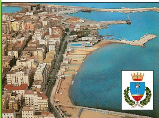
Comune di Crotona (KR) Regolatori di potenza 420KVA 420KVA Power regulators